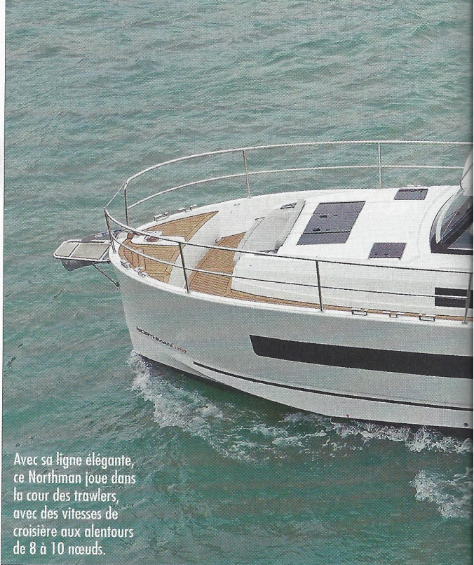
Avec sa ligne élégante, ce Northman joue dans la cour des trawlers, avec des vitesses de croisière aux alentours de 8 à 10 nœuds.

Dans les deux cas, le bateau a été pensé pour passer de longs séjours à bord, comme en témoignent son plan de pont et ses aménagements. Prolongé par une immense plage de bain arrière, le cockpit, bien abrité par la casquette du hard-top, est sécurisant avec sa grande banquette en L. Sous le plancher, la soute de rangement présente des dimensions impressionnantes et donne facilement accès au moteur. La belle largeur des passavants symétriques offre une circulation facile jusqu'à la plage avant, où se trouve une agréable banquette. L'une des grandes