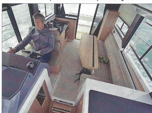
Le carré profite d'une belle luminosité grâce aux vitrages latéraux dont certains sont ouvrants.