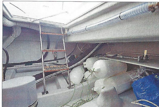
Une soute située dans le cockpit permet de loger beaucoup de matériel, à commencer par les défenses.