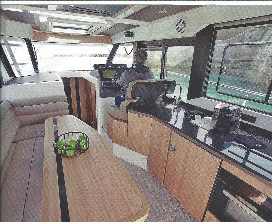
La présence de meubles en bois et de selleries aux tons clairs donne un charme classique à ce trawler fabriqué en Pologne.