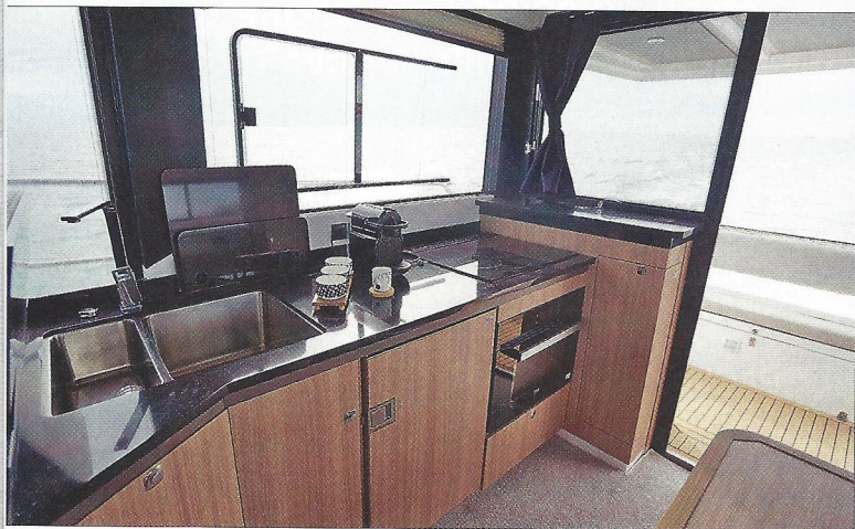
La cuisine, très bien équipée, est située contre le bordé de tribord. La vitre arrière se soulève pour une meilleure circulation de l'air à bord.