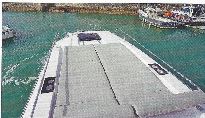
Le rouf de la version essayée était occupé par un magnifique bain de soleil, mais une version fly est également prévue pour 2020.