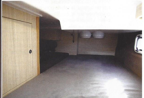
A bâbord de la descente un lit double est au programme mais l'espace est restreint en version in-bord. Effectivement il s'agit plutôt d'un couchage individuel avec un renforcement.