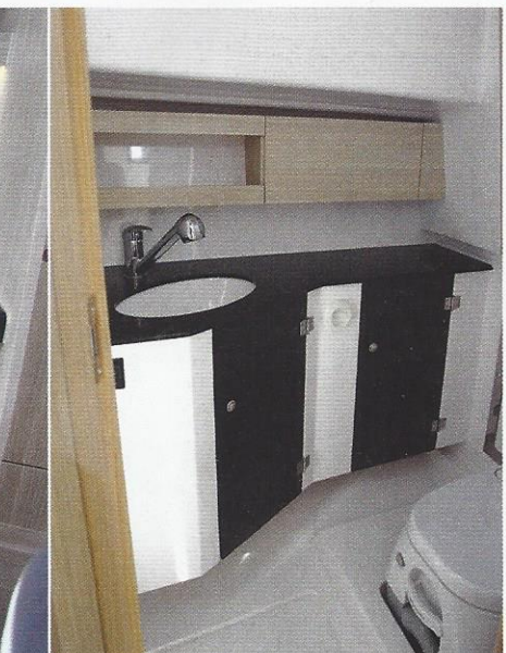
Digne d'un véritable appartement, l'espace cuisine est particulièrement bien aménagé avec un spacieux plan de travail. La salle d'eau présente un traitement plutôt cosy.